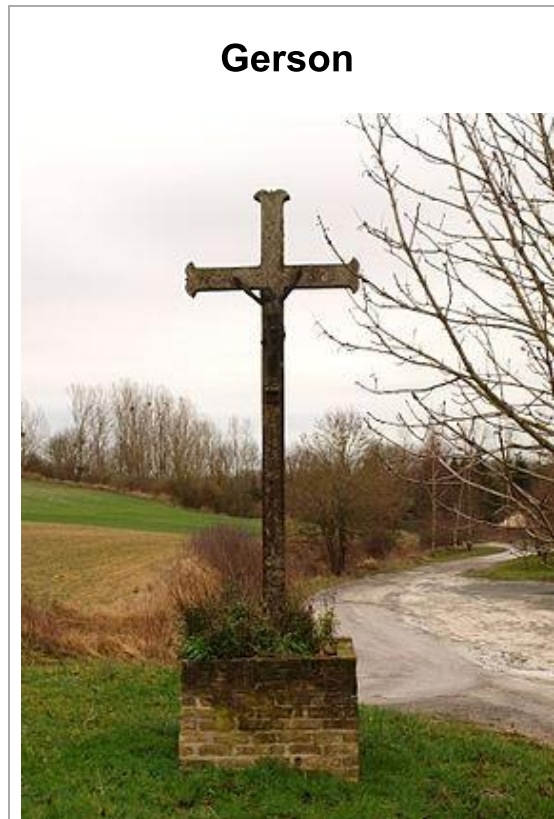
Croix élevée à l'emplacement où se trouvait la Croix Saint-Martin , qui marquait l'emplacement de la chapelle de Gerson .

Une croix indique le lieu hypothétique où se trouvait Gerson 1 . Il y a environ 800 mètres de ce lieu à l'église de Barby. Les deux villages étaient mitoyens.